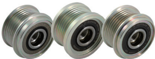
画像2：オーバーランニングオルタネータープーリー 535 0063 10 (左)、535 0202 10 (中央)、 535 0203 10 (右)

オーバーランニングオルタネータープーリーを取り付けることで、フロントエンド補助ドライブがエンジンの不規則な回転の影響を受けなくなり、Vリブベルトがより円滑かつ静かに動作します。その結果、エンジンが静音化され、走行時の快適性が向上します。